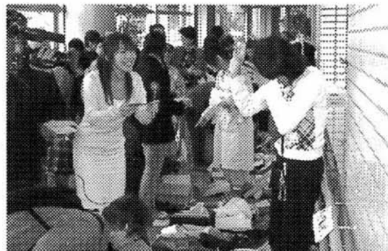
やはり一番の思い出は「オールDEバザールINコンパバル」。大信村の野菜、おいしかったですね！