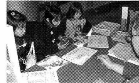
「小さな理解者」をもっと増やしていければと思っています

実際に参加していただきたいと思っています。そして、もっと「使いやすい」オールにしようと思案中です。もっと手軽に、誰もが使えるオール。しかしながら、お互いをつなぎ合い、支え合うオール。もっとオールを身近に感じてもらえるような仕組みづくりに取り組んでいきます。