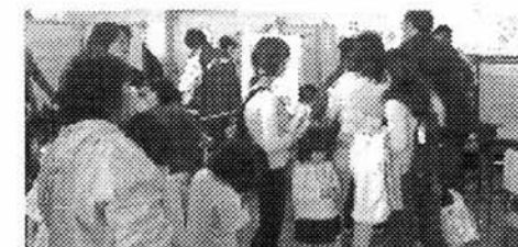
地域福祉計画「見たい・知りたい・イベントだいい」では、綿あめ作りを楽しんでもらいました。