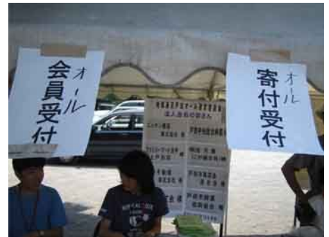
▲毎回このような形で実施します。 皆さん、お気軽にお越し下さい