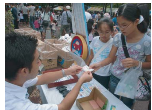
「かみとだゆめまつり」でのプレ交換会 2011年9月25日 288個集まりました!